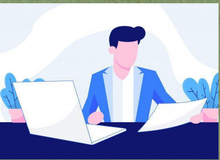
Analisis Perencanaan Pembangunan