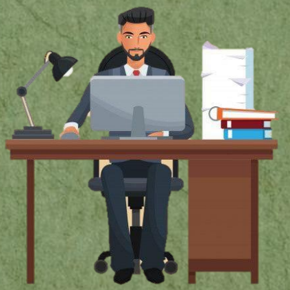
Menyusun Darft Laporan