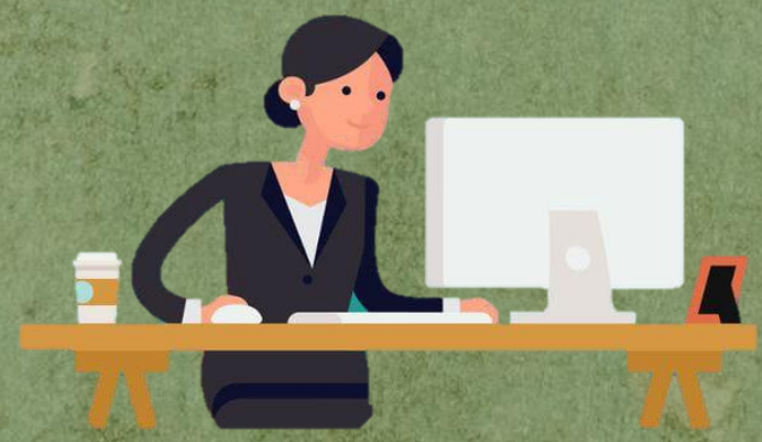
Pencermatan Draft Hasil Laporan